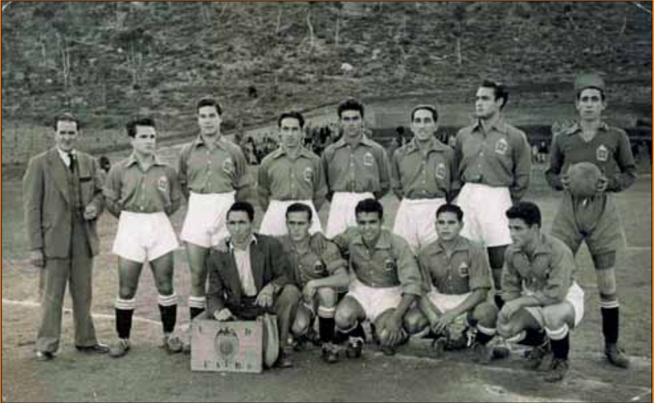
U.D. Faura en el camp de fútbol, anys 40.