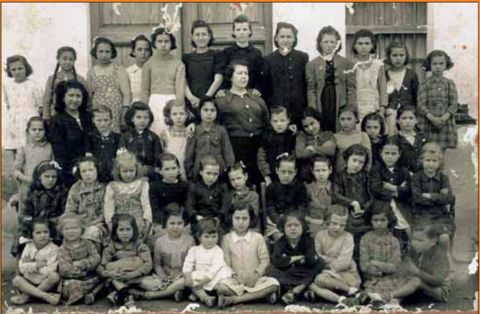
Xiques a l'escola, finals dels anys 40.