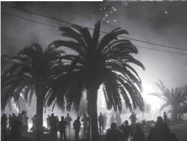
• V Jornades Diablers del País Valencià