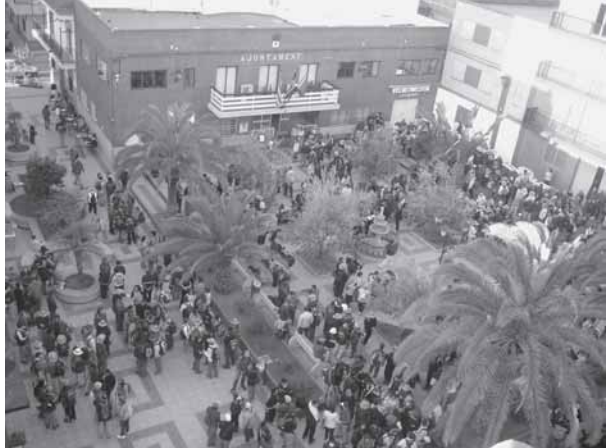
• IV Marxa a Peu Camp de Morvedre