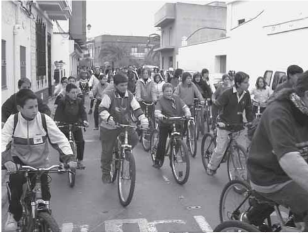
• Dia de la bici