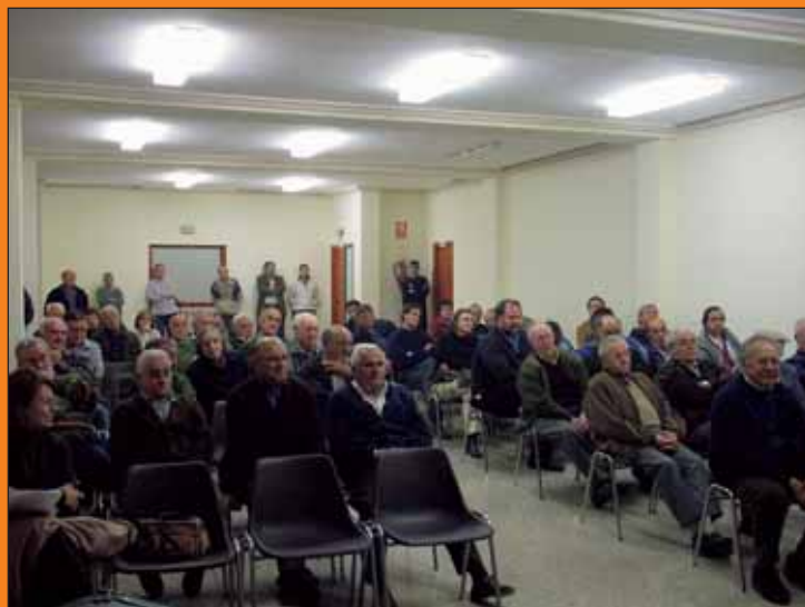
Audiència pública sobre el pressupost i les festes (2 desembre 2004)