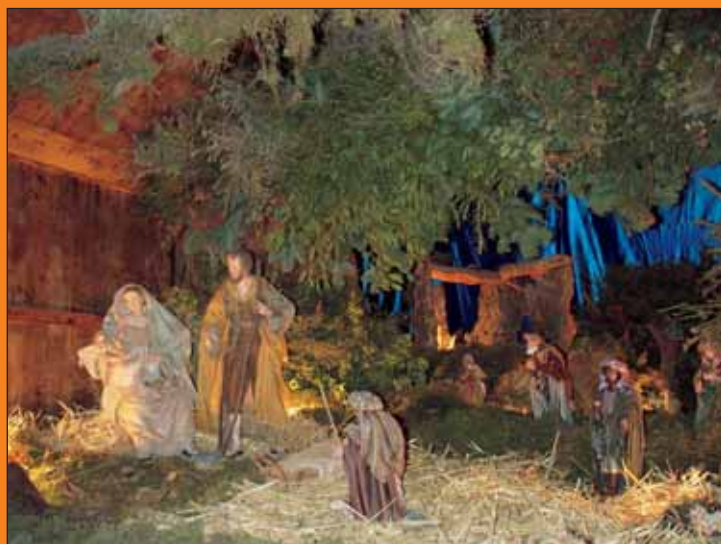
“Betlem del llavaner” (desembre 2004)