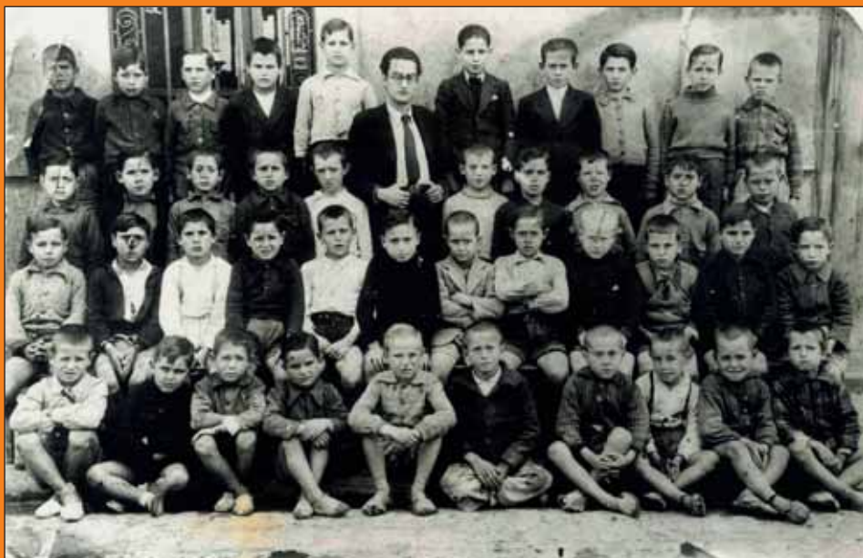
Escolars any 1941. Els noms dels alumnes es podreu veure a l'entrada de l'Ajuntament