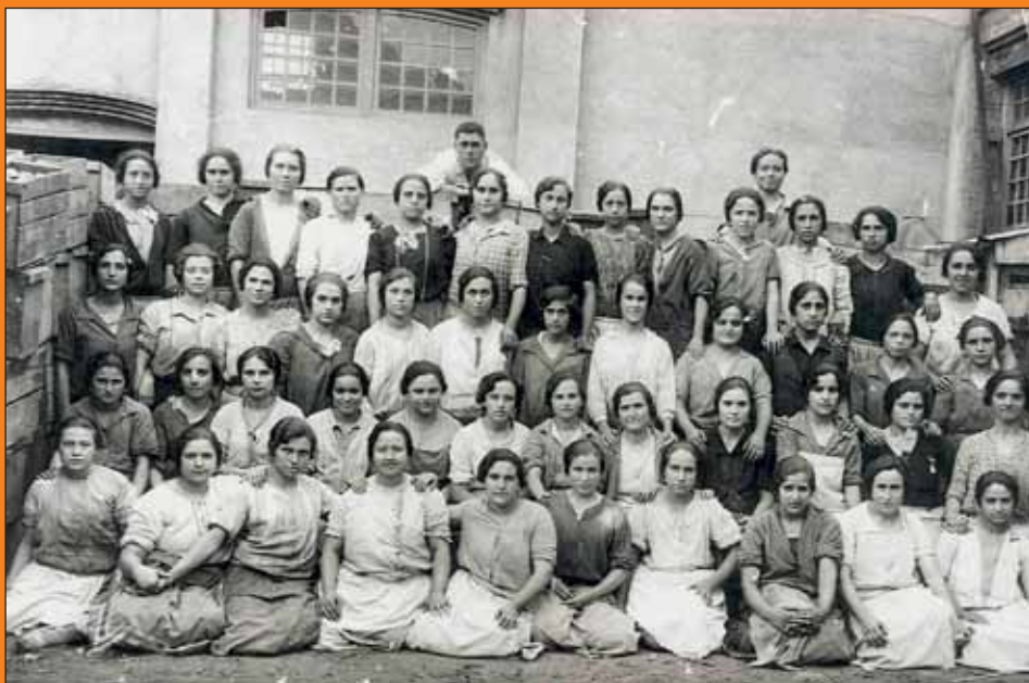
Magatzem de taronja. Primer terç del s. XX