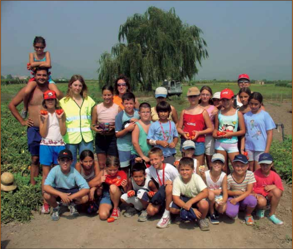
Visita de l'escola d'estiu a les marjals, juliol 2004.