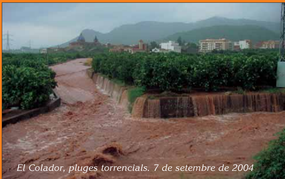
El Colador, pluges torrencials. 7 de setembre de 2004

Època 10 • Any 20 • Núm. 6 • Octubre 2004