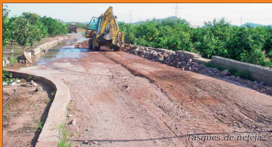
Tasques de neteja.