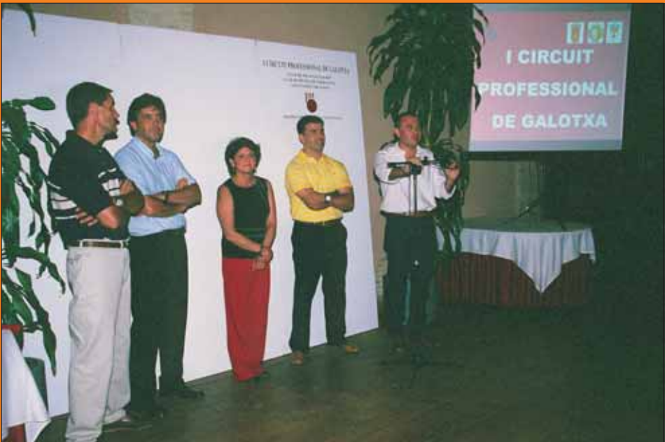
Presentació del I Circuit Professional de Galotxa. (6 juliol 2004)