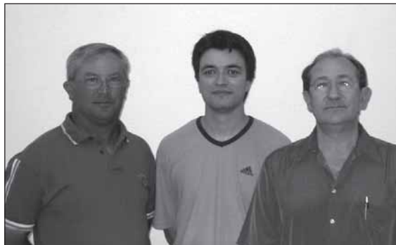
GRUP MUNICIPAL NACIONALISTA DE FAURA ■