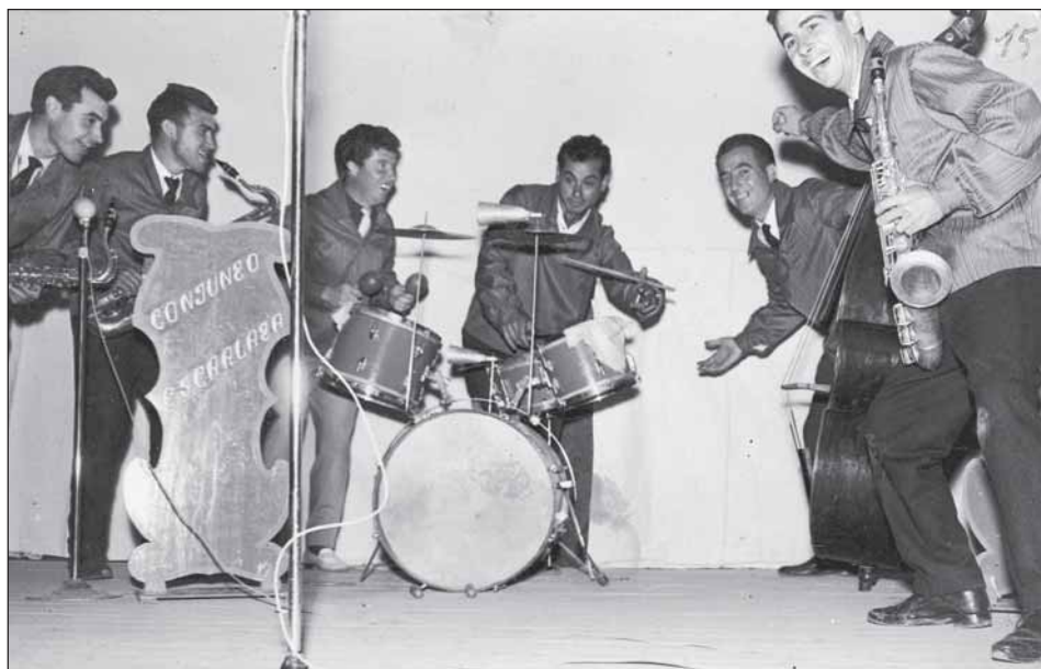
Anys 60. El "Conjunto Escarlata".