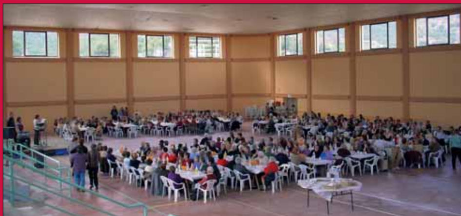
Celebració Dia de la Dona Treballadora en el Pavelló Multiusos (6 març 2004)