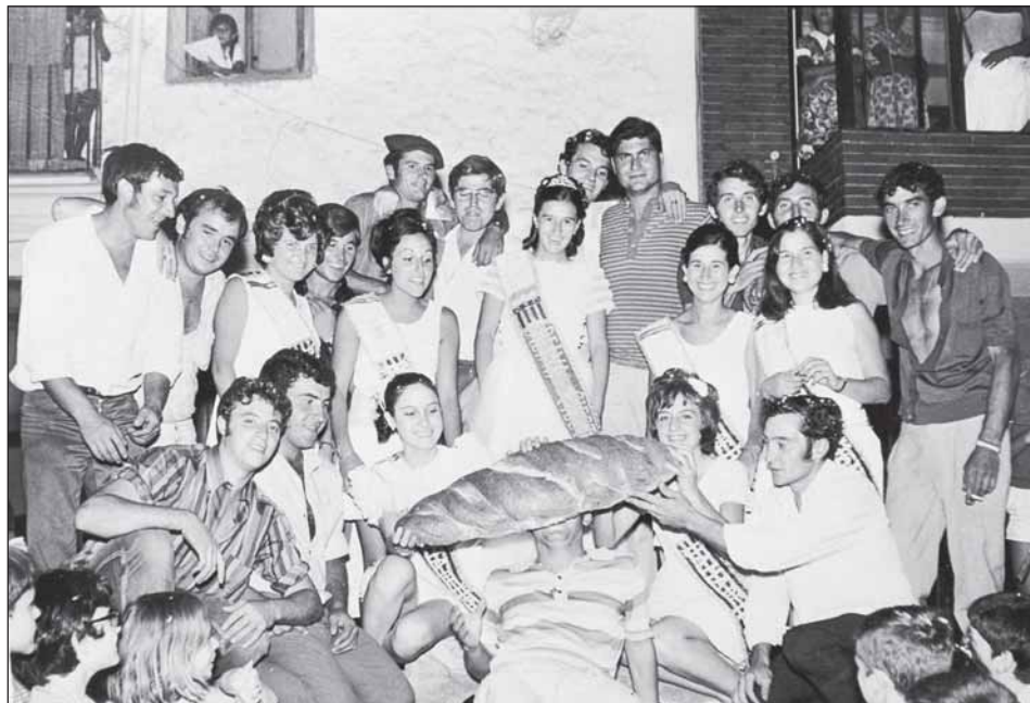
1970. FESTES D'AGOST. Els festers i la reina de les festes.