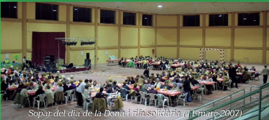
Sopar del dia de la Dona i rifa solidària (11-març-2007)