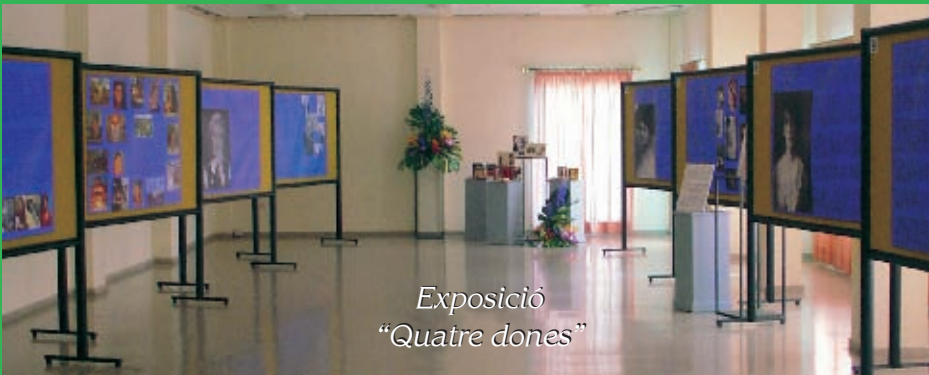
Exposició "Quatre dones"