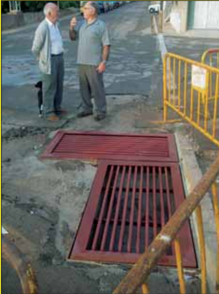
Almorig, aigües fora