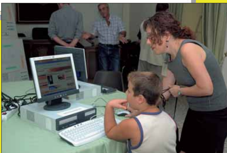
Presentació de la web de Faura