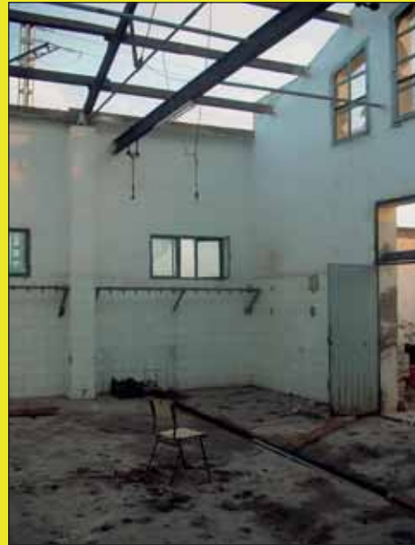
Obres a l'escorxador